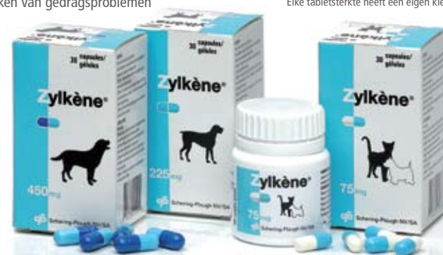
Elke tabletsterkte heeft een eigen kleur